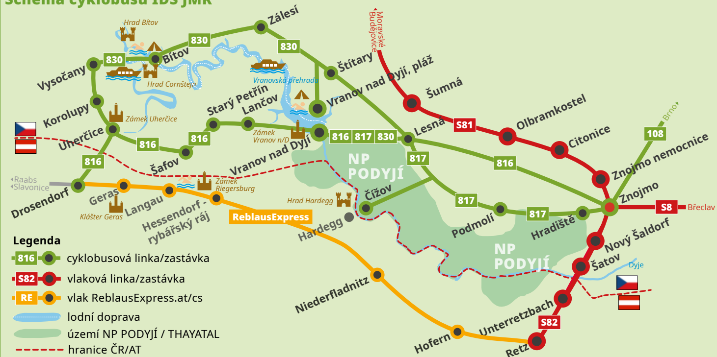
Schéma cyklobusů IDS JMK

Jízdenky IDS JMK platí také ve vlacích včetně jízdy do Retzu, neplatí na lodní dopravě po Vranovské přehradě a v ReblausExpressu.