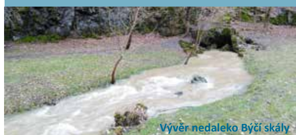
Vývěr nedaleko Býčí skály