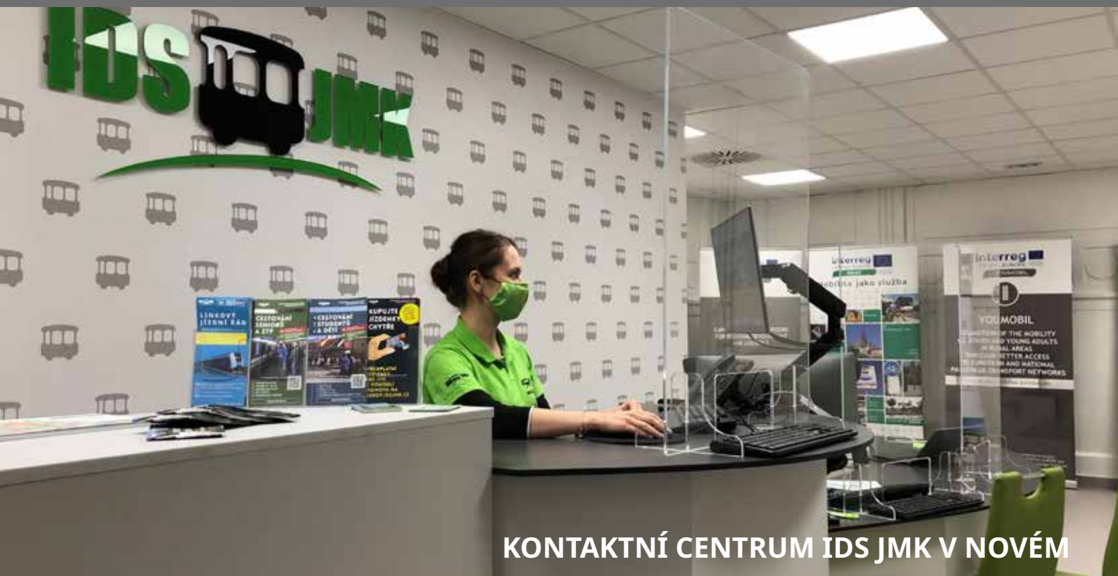
KONTAKTNÍ CENTRUM IDS JMK V NOVÉM